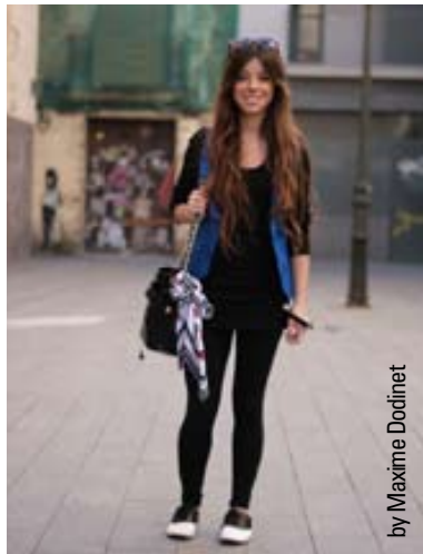
by Maxime Dodinet