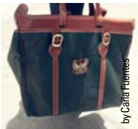
by Caria Fuentes